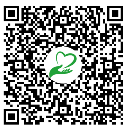
Scan en Doneer